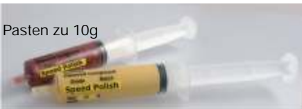
Pasten zu 10g