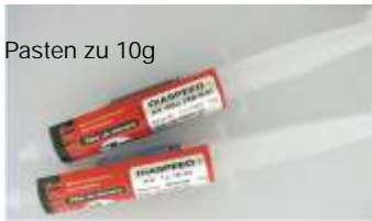
Pasten zu 10g